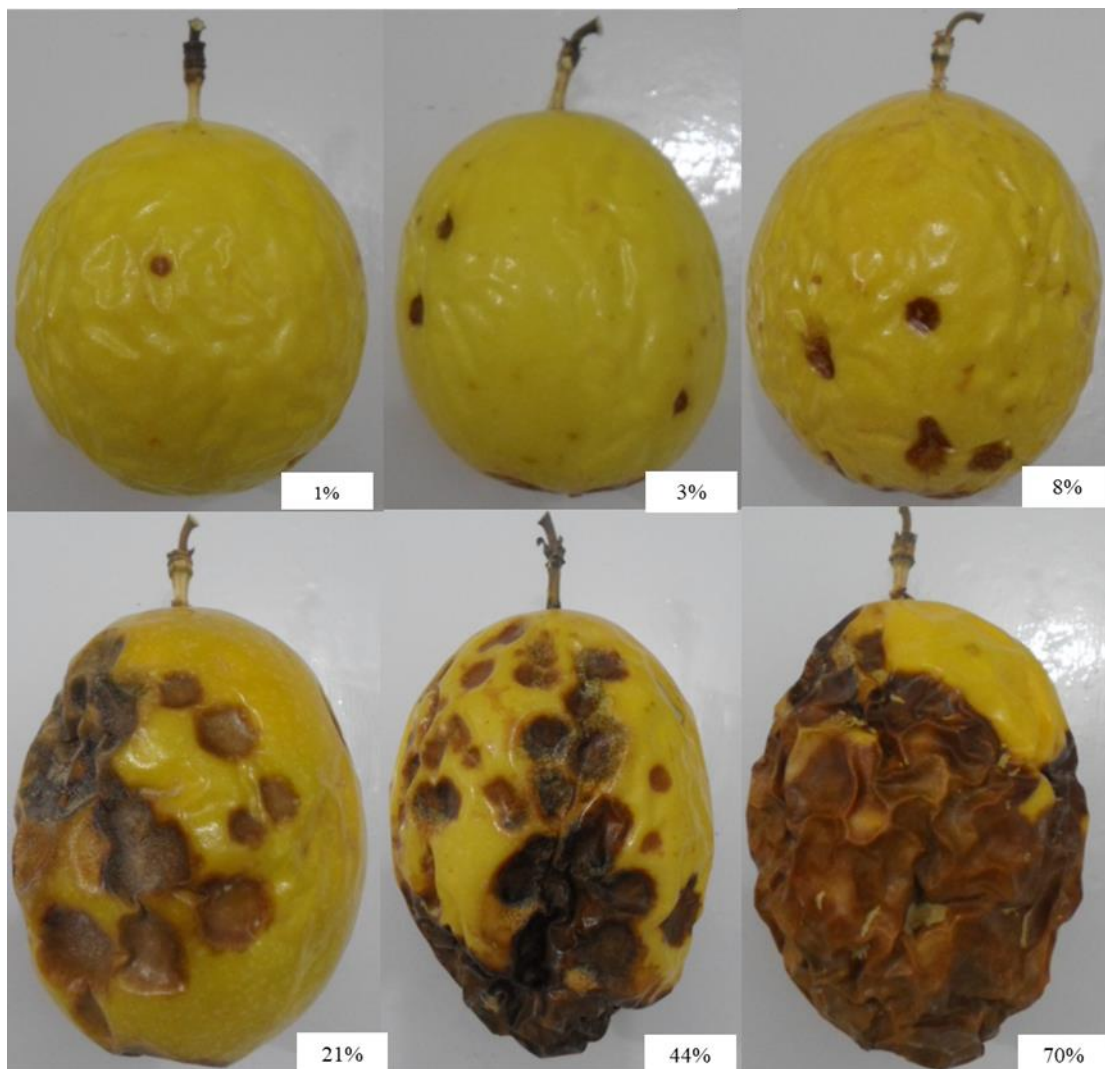
Figure 1. A diagrammar scale of anthracnose ( Colletotrichum spp.) in yellow passion fruit ( Passiflora edulis f. flavicarpa ) adapted by Fischer et al. (2009).

Figura 1. Escala diagramática da antracnose ( Colletotrichum spp.) em frutos de maracujá amarelo ( Passiflora edulis f. flavicarpa ) adaptada de Fischer et al. (2009).